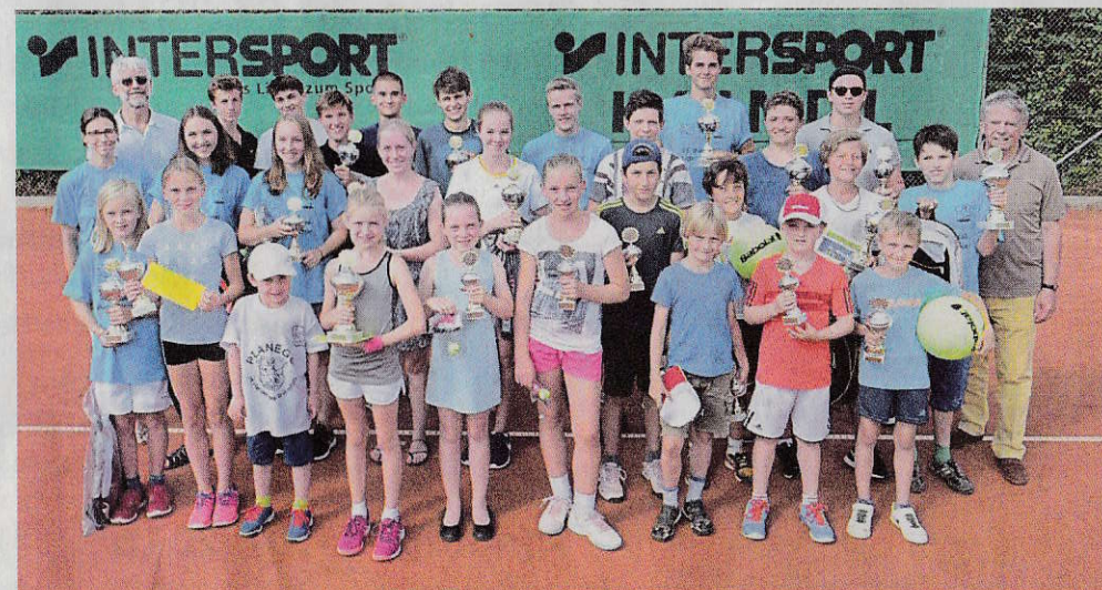
Die Sieger freuten sich über Pokale und kleine Sachpreise.